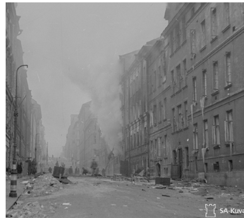
Meritullinkadun alkupäätä 27.2.1944 kolmannen pommitusyon jälkeen.