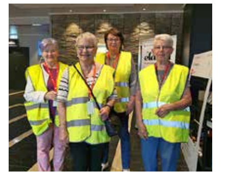
Pohjois-Karjalan piirin vapaaehtoiset vastasivat siitä, että kaikki sujuu joustavasti